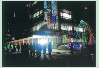
「年末の交通安全運動」の活動として警察署前においてイルミネーション点灯式を実施した。(諏訪)