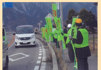
「年末の交通安全運動」の活動として県道において人波作戦を実施した。(池田松川)