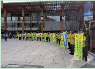
「年末の交通安全運動」の活動として長野駅前広場において街頭活動を実施した。(長野)

交通安全協会は、交通事故をなくすため、様々な活動を行っています。活動の一例を紹介します。