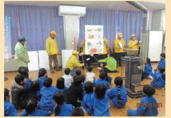
管内の小学校において1・2年生を対象とした通学路危険箇所についての交通安全教室を開催した。(千曲)