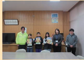
管内の佐久穂町小学校において新入学児童に贈呈する交通安全グッズの贈呈式を実施した。(南佐久)