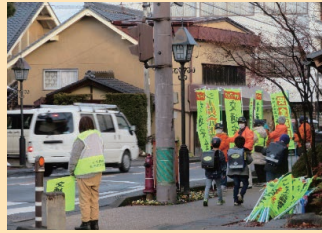
「年末の交通安全運動」の活動として管内の交差点において人波作戦を実施した。(須高)