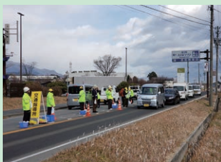
「年末の交通安全運動」の活動として道の駅前において「交通指導所」を開設した。(伊南)