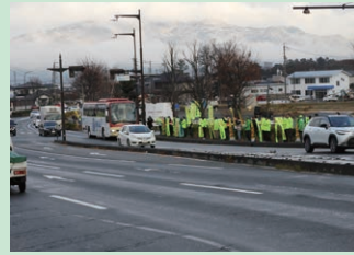
「年末の交通安全運動」の活動として松代大橋前県道において街頭活動を実施した。(長野南)