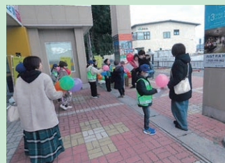
「年末の交通安全運動」の活動として商業施設において交通少年団等による街頭活動を実施した。(安曇野)