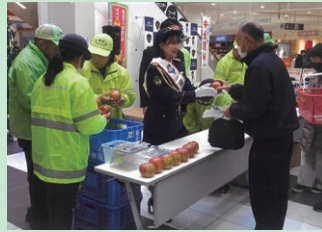
「年末の交通安全運動」の活動として商業施設において「交通安全リング」を配付した。(川西)