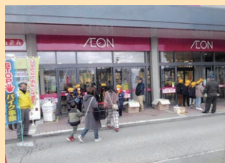
「年末の交通安全運動」の活動として商業施設において交通少年団等による街頭活動を実施した。(飯伊)