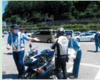
国道19号沿いの道の駅において、二輪車対象の交通安全啓発活動を実施した。(木曾)