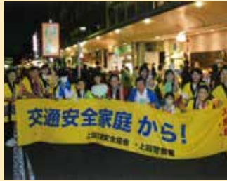
踊り連を編成して市民祭「上田わっしょい」に参加し交通安全を呼びかけた。(上田)