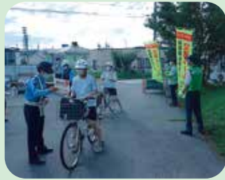
管内の中学校において、自転車事故防止啓発活動を実施した。(小諸)