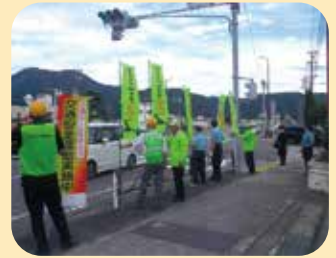
夏の交通安全運動の活動の一環としてJR信濃大町駅前において街頭啓発活動を実施した。(大町地区)