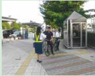
夏の交通安全運動の活動の一環としてJR茅野駅前において自転車ヘルメット着用を呼びかけた。(茅野)