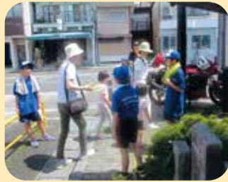
夏の交通安全運動の活動の一環として交通少年団が安全運転を呼びかける街頭啓発活動を実施した。(飯伊)