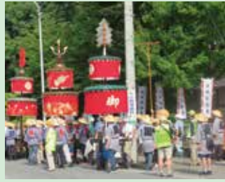
須坂祇園祭で交通整理に従事し、参加者の安全確保と交通の円滑に努めた。(須高)