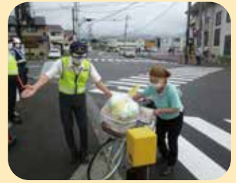
夏の交通安全運動の活動の一環として管内の交差点で自転車ヘルメット着用を呼びかけた。(長野南)