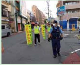
夏の交通安全運動の活動の一環として長野市内の繁華街で飲酒運転根絶を呼びかけた。(長野)

交通安全協会は、交通事故をなくすため、様々な活動を行っています。活動の一例を紹介します。