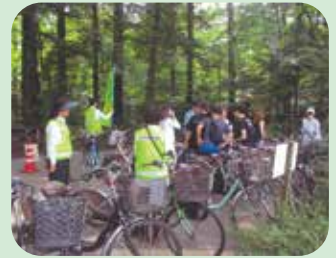
レンタサイクルを利用して訪れた外国人観光客に通訳を介して交通事故防止を呼びかけた。(軽井沢)