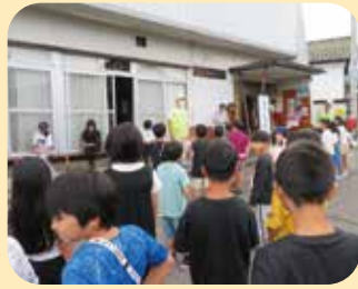
夏休みのラジオ体操に集まった小学生を対象とした交通安全教室を開催した。(中高)