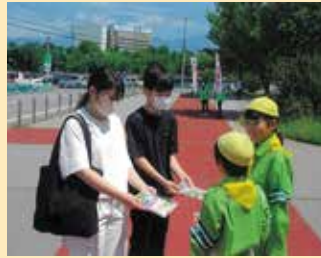
夏の交通安全運動の活動の一環として交通少年団が安全運転を呼びかける街頭啓発活動を実施した。(佐久)