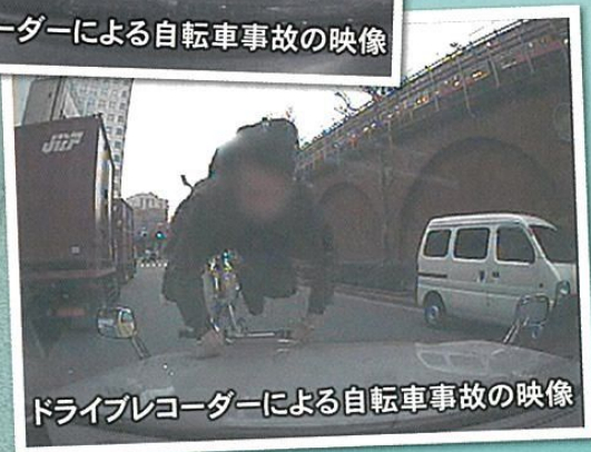
ドライブレコーダーによる自転車事故の映像