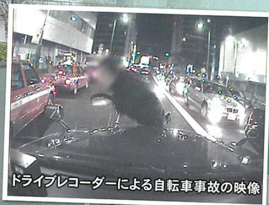
ドライブレコーダーによる自転車事故の映像