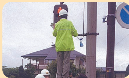
管内に設置された歩行者用信号機、カーブミラー等の点検・清掃を実施した。