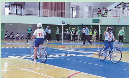
市内の総合体育館において交通安全子供自転車安曇野地区大会を開催した。