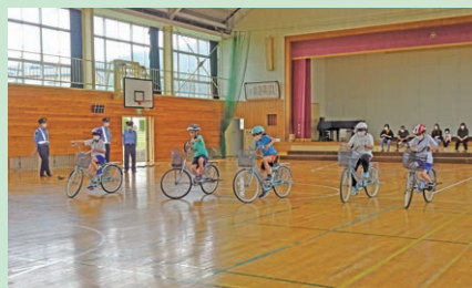
管内の小学校体育館において交通安全子供自転車伊那地区大会を開催した。