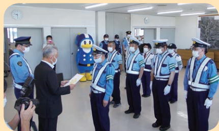
富士見町役場において、安協支部役員に対する「ふれあいアドバイザー」委嘱式を開催した。