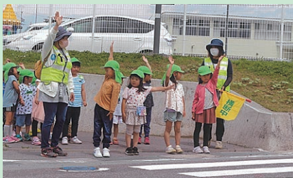
管内の保育園児に園外の道路で正しい横断方法を指導した。