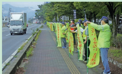
「夏の交通安全運動」の活動の一環として川中島古戦場史跡公園前県道において街頭指導を実施した。