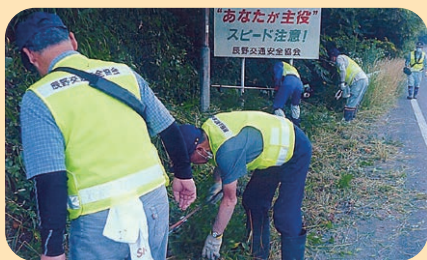
町内に設置された交通安全関係の看板を点検清掃するとともに、周辺の草刈りを実施した。