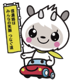
長野県交通安全協会 マスコット 「あんぎょーくん」