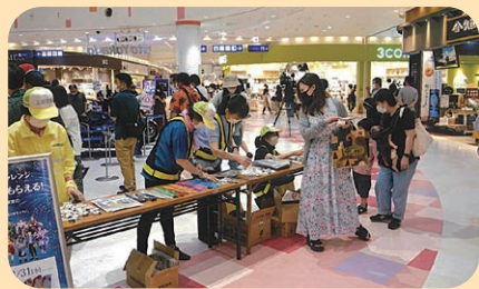
管内の大型商業施設で開催されたイベントにおいて交通安全啓発活動を実施した。