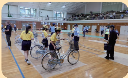
市内の体育館において交通安全子供自転車須高地区大会を開催した。