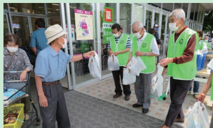
大型ショッピングセンターにおいて高齢者交通事故防止啓発活動を実施した。

交通安全協会は、交通事故をなくすため、様々な活動を行っています。活動の一例を紹介します。