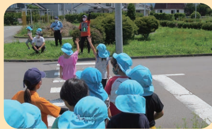
自動車教習所において保育園児に対する交通安全教室を実施した。